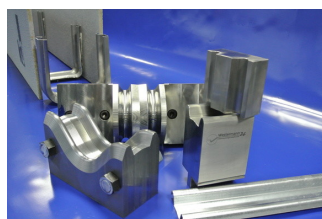
Stationswerkzeug: 1xHub= 1x Bauteil