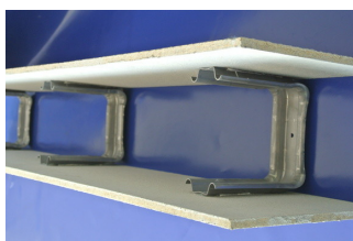
Halterung für Verschalung